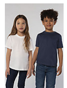
SOL'S REGENT KIDS 11970